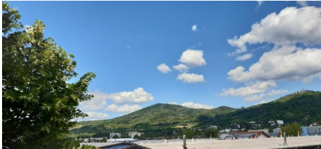
Ausblick - Schlafzimmer