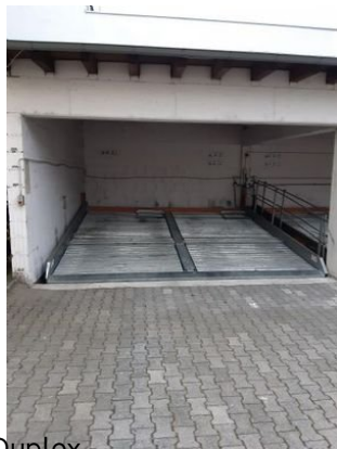
Duplex - Stellplatz