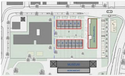
Häuser 1-6, Wohnfläche 153,79 m 2 bis 162,24 m 2 , Grundstück 181,02 m 2 bis 276,47 m 2 - bereits im Bau Häuser 7-13, Wohnfläche 137,78 m 2 bis 161,98 m 2 , Grundstück 169,75 m 2 bis 300,32 m 2 - in Vorbereitung