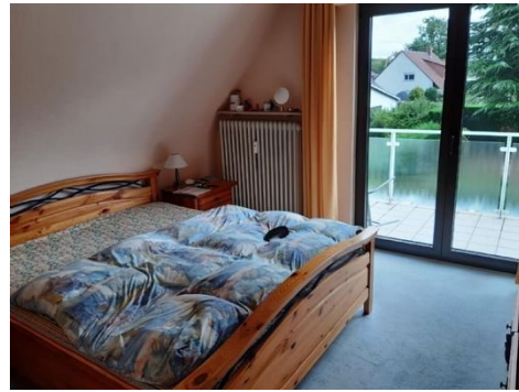
Kind/Gast/Arbeiten mit Zugang zum Balkon