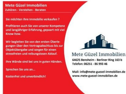
Zuhören – Verstehen – Beraten