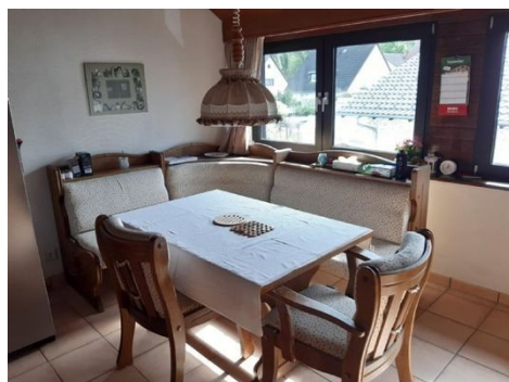
Küche mit Essplatz