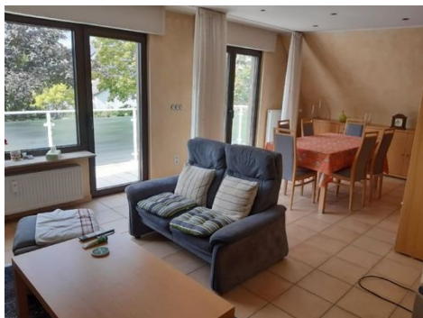
Wohnen/Essen mit Zugang zum Balkon