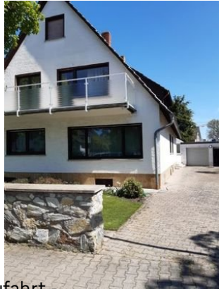
Zufahrt - Garage