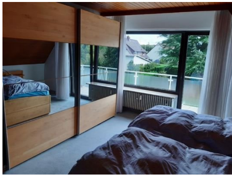
Schlafen mit Zugang zum Balkon