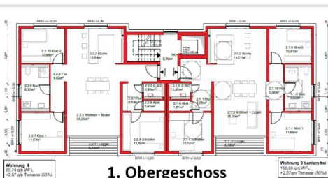
Grundriss 1. Obergeschoss