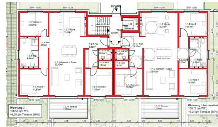
Grundriss - Erdgeschoss