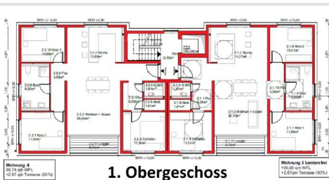
Grundriss 1. Obergeschoss