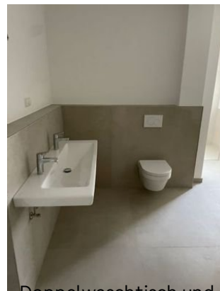
Bad – Doppelwaschtisch und WC