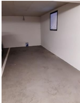
Tiefgaragenplatz mit Anschluss für E-Mobilität