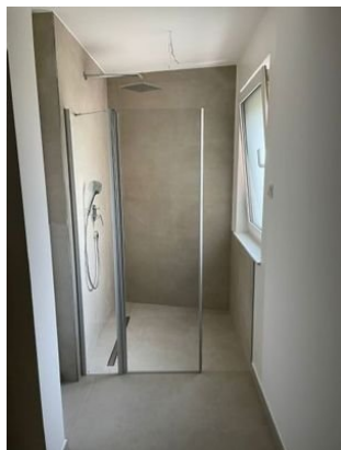
Bodengleiche Dusche im Bad