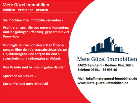
Mete Güzel Immobilien