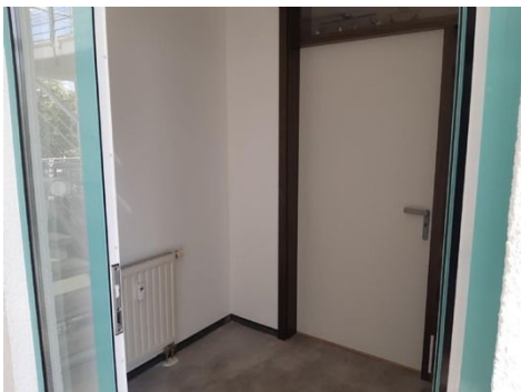
Eingang - Garderobe