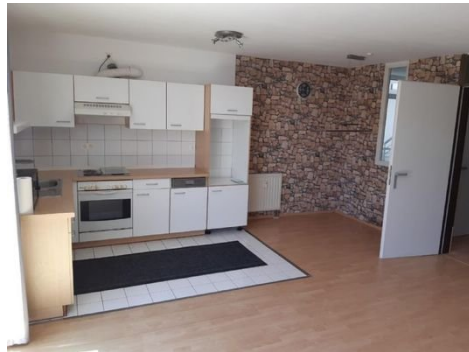
Küche mit Essecke