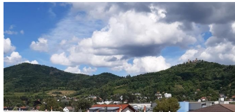
Blick aus dem Schlafzimmer