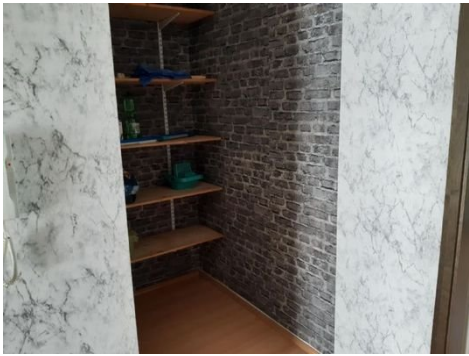
Flur mit Abstellbereich